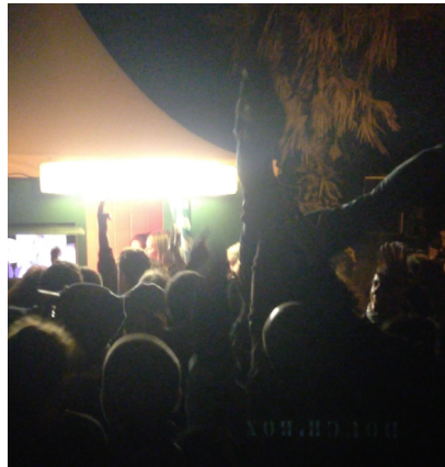
La Douch'box pendant le Festival Visions à Brest