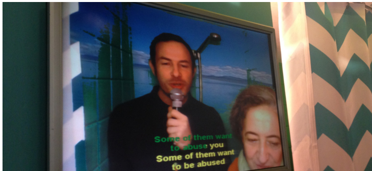
Tainted love - Soft Cell / Lavant Seine à Colombes (92)

Vous avez la sensation agréable de vous réveiller avec la bonne humeur requise ! En même temps que les paroles de la r chanson qui s'affichent, vous pouvez admirer votre performance en direct dans un clip dans lequel vous vous retrouvez sous une pluie tropicale au fin fond de la cordillère des Andes ou encore au beau milieu des chutes du Niagara, et avec une particularité notable, vos prouesses aquatiques sont diffusées à l'extérieur, à votre corps défendant (quoique très consentant)... Vous êtes sous votre douche en toute intimité, et vous êtes la star d'un clip original et unique qui ne sera plus jamais diffusé, devant un public circonspect, ou en délire... puisqu'il peut aussi chanter avec vous en chœur !!!