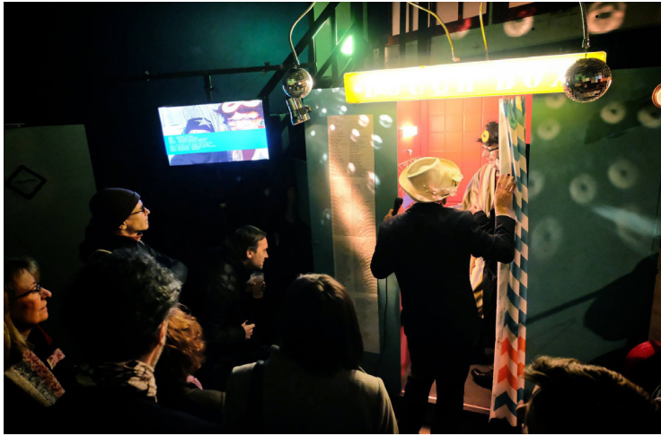
La Douc'box pendant les Dimanches à Rennes des Tombées de la Nuit - Janvier 2019